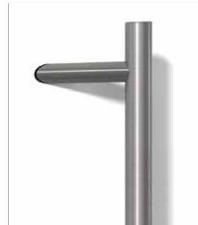
Edelstahl Schrägriff G-1021 (800mm)