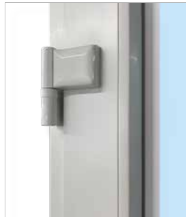
Drei stabile Bänder tragen den Türflügel.