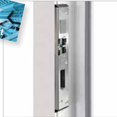
Drei massive Schließbleche sichern die Tür.