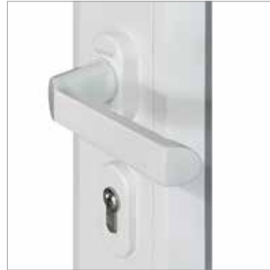
Der moderne Innentürdrücker ist weiß.